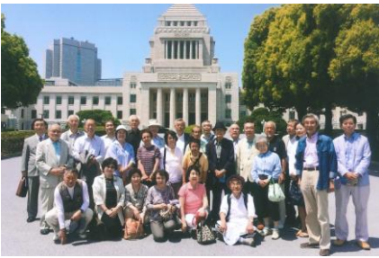
(国会議事堂前にて)

昨年に続き第2回東京社会見学ツアー(国会議事堂、防衛省市ヶ谷地区見学)を5月15日(金)に開催し、参加者は28名で、40人乗りのバスの車内もゆったりと快適でした。今年は見学先を2か所に絞り、午前と午後で各1か所と時間的にもゆっくと見学ができました。