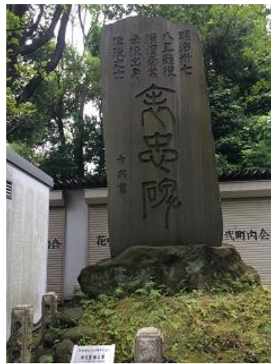
表忠碑 (伊勢山皇大神宮構内)

Y校の歴史の中にもこのように胸が痛くなることがありました。戦争というものを肌で実感したような気がしました