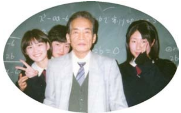
<女生徒からの手紙>

この高校をやめるとき、ある女生徒(国際科2年)から、下のような手紙をもらった。私は教師をやめて12年も過ぎた今も、この手紙をいい思い出として持っているのである。