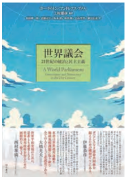
『世界議会—21世紀の統治と民主主義』上村雄彦（監修、翻訳） 2025年4月10日 明石書店

次に、主権国家体制という国際政治構造である。もし私たちが山羊飼いだとしたら、可能な限り多くの草を食べさせて、太らせて、数を増やして豊かになるうとするだろう。もしそれをすべての山羊飼いがやり続けたら、いつか共同の牧草地はげ山になり、全員が共滅するだろう。これは「コモنزの悲劇」と呼ばれるが、今の国際社会