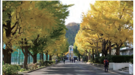
秋のプロムナード