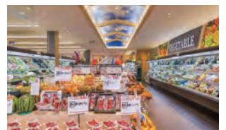
スーパーマーケット事業部 スーパー生鮮館TAIGAの運営