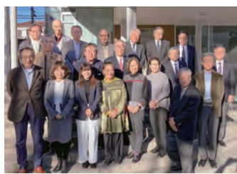
横浜6大学同窓会交流会（横浜SIX） 2024年12月8日

「横浜6大学同窓会交流会（横浜SIX）」は、一橋大、東京科学大、横浜国大、横浜市大、神奈川大、関東学院大の6大学の同窓会で構成されています。