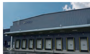
フローズン事業部 アイスクリーム・冷凍食品の卸売