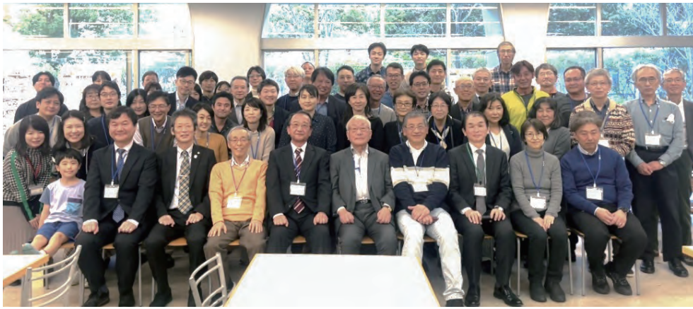
2024年12月の集合写真@シーガルセンター

理学系では、文学部理科、理学部、国際総合科学部、そして2019年からの理学部に再編された理学系の全卒業生、また、総合理学研